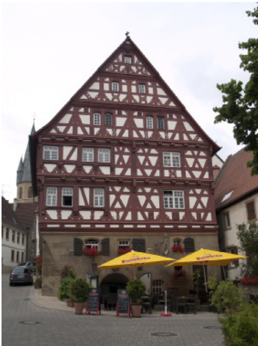
Vorbild für das Modell ist ein Haus in Eppingen.

Version I schwarz-weiß (zur eigenen farbigen Gestaltung) Version II farbig angelegt, Version III um Rechner colouriert