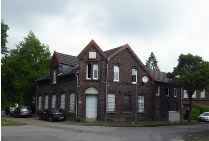
Das Gebäude heute

Das Modell im Maßstab 1:87 (HO) orientiert sich an den Plänen eines alten Konsums in Bottrop Ebel (gehörte früher zu Essen). Es stimmt im Wesentlichen mit dem Bauzustand von 1926 überein, als an das Gebäude ein Flachbau als Warenlager angebaut wurde.